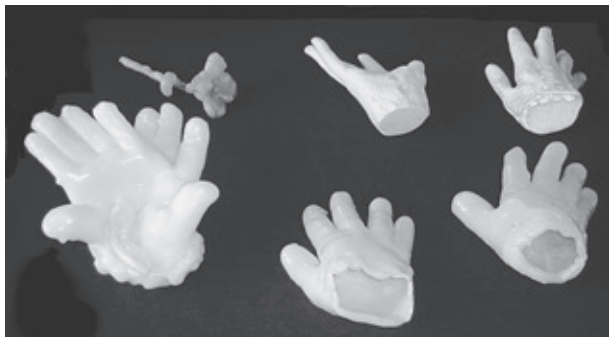
Luas de parafina

Este é o método mais comum. Se enchermos a luva fabricada com gesso molhado, teremos a reprodução fiel da mão humana, notando-se todas as linhas originais e até mesmo os cabelos e poros da pele. Os moldes de parafina são feitos somente nas materializações parciais, pois não há prejuízos ao médium, que não está com seu duplo etérico envolvido no caso.