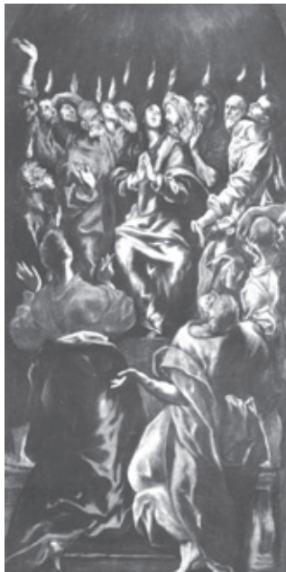
Dia de Pentecostes: manifestação de espíritos

A vidência é exemplificada por Daniel (8:15), onde conta: “Havendo eu, Daniel, tido uma visão, procurei entendê-la e eis que se apresentou diante de mim com aparência de homem, veio, pois, para perto donde eu estava; ao chegar ele, fiquei amedrontado e prostei-me com o rosto em terra; mas ele me disse: Entende, filho do homem, pois esta visão se refere ao tempo do fim”. O mesmo Daniel (10:5) afirma: “Levantei os olhos e olhei, vi um homem vestido de linho, o seu rosto como um relâmpago. Só eu, Daniel, tive aquela visão; os homens que estavam comigo nada viram, não obstante, caiu