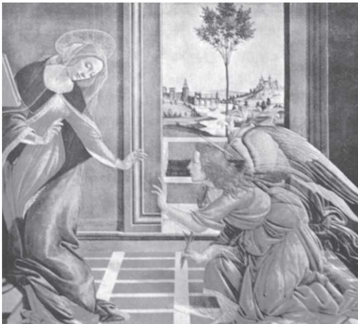
O anjo e Maria: comunicação mediúnica